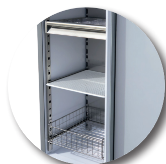
Divers aménagements possibles