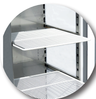
Clayettes en fil d'acier plastifié blanc (équipement de base)